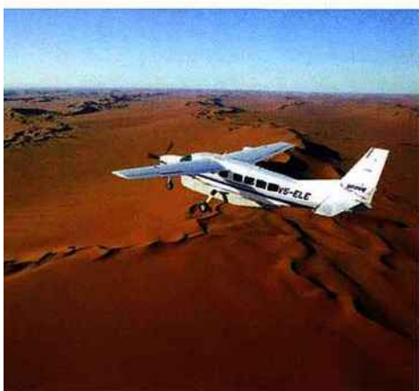
Découverte du désert à bord d'un Cessna. / Namibie (5)

Playing the explorer and having it filmed is the latest idea firing thrill-seekers' imaginations. In association with Peplum, the Somewhere Club has devised the HD Travel Experience: accompanied by experts and film crews, adventurous tourists discover far-flung corners of the globe and bring back a souvenir documentary made by Ushuaia Nature. After exploring the seabed and Indonesia's volcanoes then sailing on the world's fastest trimaran, the third HD Travel Experience took 10 lucky people off to Antarctica in January 2014, accompanied by experienced mariners, high-mountain guides and world freediving champion Frédéric Buyle; there they dived in glacial waters to swim with hump-backed whales. If playing at Robinson Crusoe in 5-star comfort is more your thing, glamping (glam camping) has become very popular in recent years, both on the ground and in the trees. Luxurious cabins are popping up all over the world, from the Kalahari and Kenya to Peru with its see-through bubble "skylodge" suspended above a sacred mountain! Away from the world with only nature for company, these upmarket camps represent a new concept in luxury holidaying and encourage us to reconnect with essentials, as in relearning to enjoy silence and time passing. Might that be the ultimate luxury, in fact?