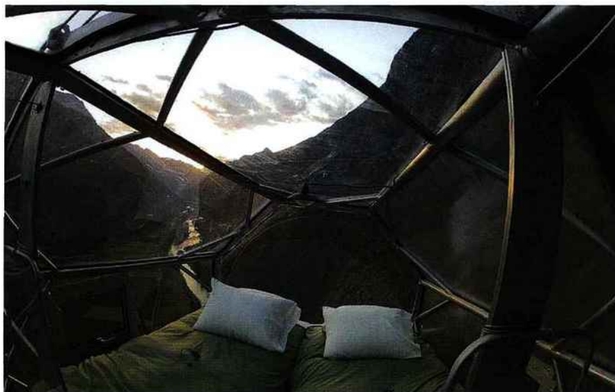
Suspendu au-dessus de la vallée sacrée, le skylodge, accessible par via ferrata, permet de passer des nuits en apesanteur. / Pérou (3)

The latest detox A new type of luxury hotel is aiming to fulfil the needs of a clientele seeking a simple, natural way to switch off, both metaphorically and literally. The Westin Dublin Hotel, for example, offers a Digital Detox Package in which you leave smartphones, tablets and other gadgets in its safe in exchange for a survival kit that includes a walking map of the city, a (real) newspaper, a relaxing candle and a board game.