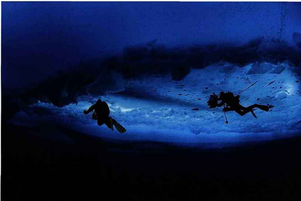
Plongée inédite sous la banquise avec l'équipe de l'expédition Under The Pole. / Groenland (4)